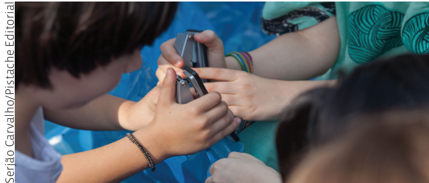
Serjão Carvalho/Pistache Editorial

Construção de um grande cubo (2 m x 2 m) que é praça e abrigo. Discussão sobre estrutura, luz, cor, transparência, relação edificação + entorno, e flexibilidade de uso.